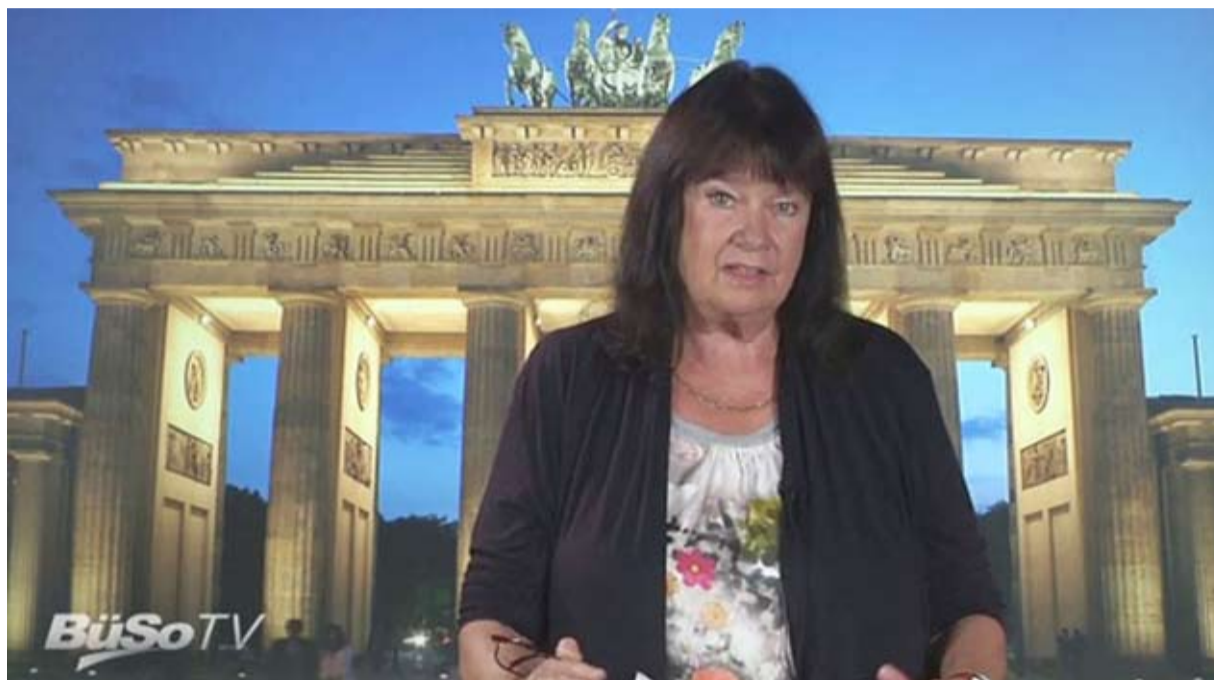
Helga Zepp-LaRouche ins Europaparlament!

Es muß jedem denkenden Menschen klar sein, daß wir kurz vor einer zivilisatorischen Katastrophe von nie dagewesenen Ausmaßen stehen, es ist aber absolut erschreckend, daß es nur sehr wenige mutige Menschen zu geben scheint, die die Gefahr beim Namen nennen: Wir steuern auf einen Systemkollaps zu, der zu einem neuen, diesmal thermonuklearen, die Menschheit auslöschenden Weltkrieg führen kann. Das Schachbrett für einen Dritten Weltkrieg ist bereits aufgestellt - ein Absturz ins wirtschaftliche Chaos würde mit an Sicherheit grenzender Wahrscheinlichkeit