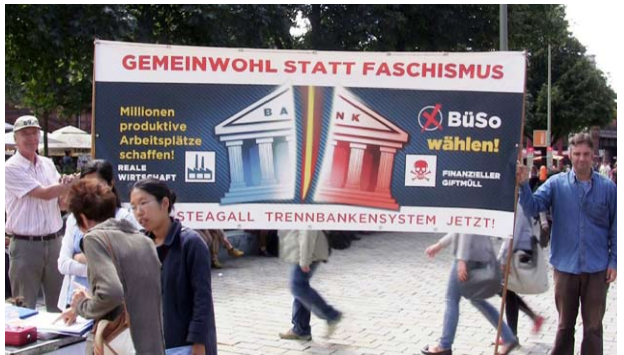
Das Finanzempire der Globalisierung ist bankrott - Glass-Steagall jetzt!

In Europa hingegen ist es niemals gelungen, das oligar-