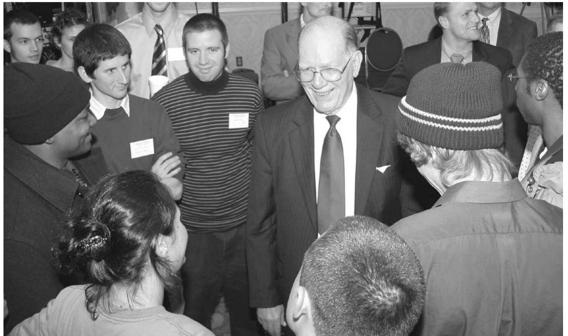
Der amerikanische Ökonom Lyndon LaRouche (hier in Diskussion mit amerikanischen Jugendlichen der LYM) ist ein entscheidender Ideengeber und Schrittmacher der demokratischen Opposition gegen das Regime Bush-Cheney in den USA.

Die Währungssysteme, die heute mit den europäischen Zentralbanken verbunden sind, sind Auswüchse des mittelalterlichen europäischen Imperialismus – d.h. des ultramontanen Systems des Finanzimperialismus, wo venezianischer Wucher zusammen mit der Brachialgewalt der normannischen Ritter herrschte. Die neuzeitliche Variante dieses feudalen Systems – die sog. „neuvezianische“ Tradition der Fraktion von Paolo Sarpi – bildete die Grundlage des anglo-holländischen liberalen Finanzimperialismus, der im 17. Jahrhundert emporkam und mit dem Pariser Vertrag von 1763 zur vorherrschenden Macht auf der Erde wurde; der Vertrag machte Lord Shelburnes Britische Ostindiengesellschaft zu dieser Weltmacht. Die Amerikanische Revolution