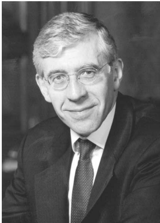
Der britische Außenminister Jack Straw ist ertappt: Er sorgte für die jüngste Eskalation der Irankrise.

Rice erhält ihre Stichworte von ihren langjährigen Mentor, George Shultz. Shultz und der frühere CIA-Direktor James Woolsey leiten derzeit das „Komitee für die gegenwärtige Gefahr“, eine berüchtigte Frontorganisation